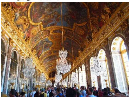
窓の光が反射してギンギラタタ 鏡はなかなか汚かったデス。笑