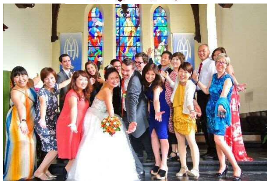
Family & Best Friends